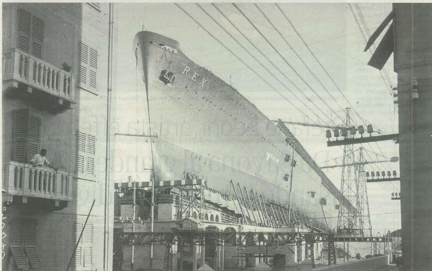
Cantieri Navali Ansaldo di Sestri Ponente, la turbonave Rex sullo scalo, 1931: il transatlantico venne varato il 1° agosto

Che fosse una nave che eccelle, non c'è dubbio. Lunga 268 metri, lo scafo in acciaio speciale, la poppa a sbalzo, la prua slanciata e fortemente inclinata, il bulbo a goccia d'acqua - il primo ad